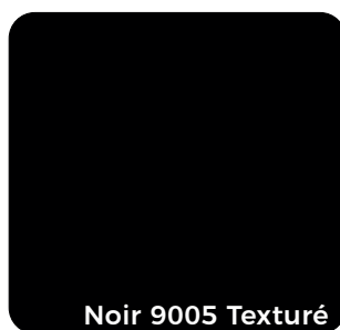
Noir 9005 Texturé