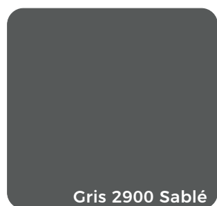
Gris 2900 Sablé