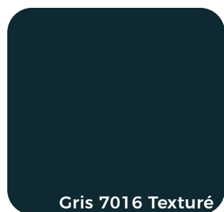
Gris 7016 Texturé