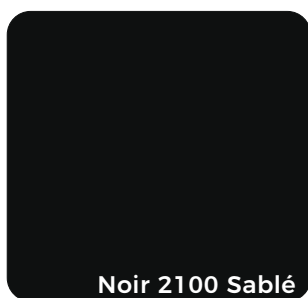
Noir 2100 Sablé