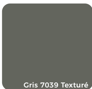
Gris 7039 Texturé