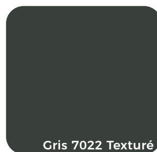
Gris 7022 Texturé