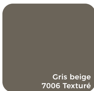
Gris beige 7006 Texturé